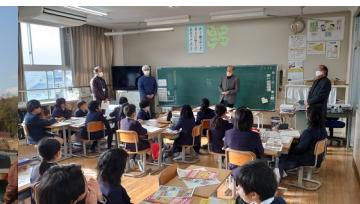
1月30日 ぼうさい教室