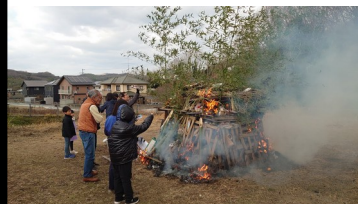
1月13日 大井とんど祭