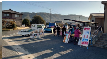
1月14日 吉田日曜朝市