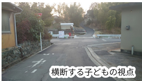
横断する子どもの視点