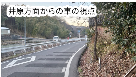
井原方面からの車の視点